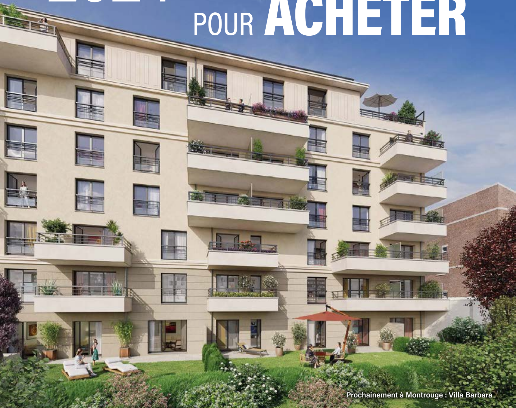
Prochainement à Montrouge : Villa Barbara

L'immobilier neuf offre de nombreux avantages pour devenir propriétaire plus facilement et en toute confiance, grâce aux frais de notaire réduits , 2 à 3% seulement contre 7 à 8% dans l'ancien, une protection juridique solide et de nombreuses garanties (financière de parfait achèvement, de non-conformités et vices apparents, de bon fonctionnement, décennale...).