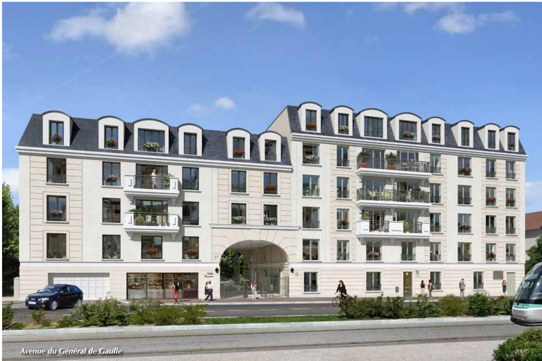
Avenue du Général de Gaulle